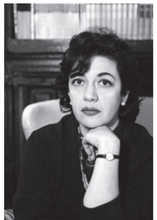
Ana María Matute