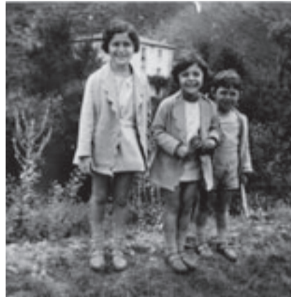
Ana María Matute con sus hermanos

Francisco Rico. Discurso de contestación al ingreso en la Real Academia Española de Ana María Matute. 18 de enero de 1998.