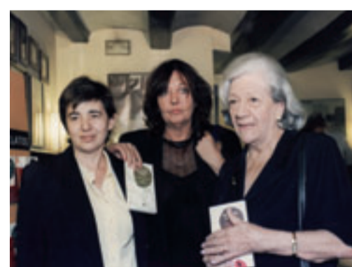
Con Ana María Moix y Cristina Fernández Cubas

Ingreso en la Real Academia Española de la Lengua en 1996 y el 18 de enero de 1998 lee su discurso y ocupa el asiento K anteriormente ocupado por Carmen Conde, siendo así la tercera mujer en ingresar en 300 años. Su discurso es respondido por Francisco Rico. Miembro honorario de la Hispanic Society of America y de la American Association of Teachers of Spanish and Portuguese. Medalla de oro del Círculo de Bellas Artes de Madrid, 2005. Doctor Honoris Causa por la Universidad de León. Medalla de Oro del Círculo de Bellas Artes de Madrid, 2006. Cruz de San Jordi, 2009. Ha sido profesora invitada en las universidades de Oklahoma, Indiana y Virginia.