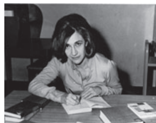
Ana María Matute dedicando un libro.

Soledad Puértolas. “Esos hilos del destino”. El Mundo , 20 de abril de 2001.