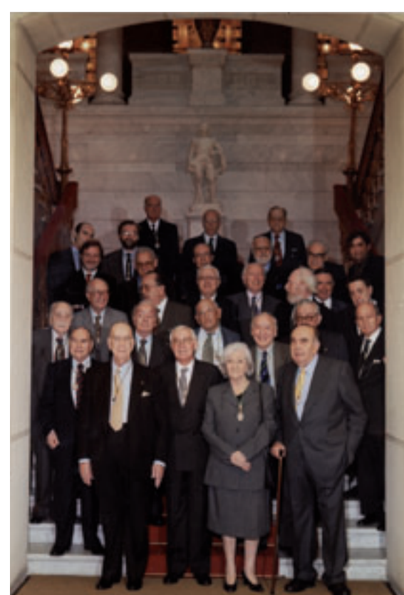
Los miembros de la Real Academia Española, entre ellos Ana María Matute (1999)

Yo nunca he estado de espaldas a la realidad, de la que también forman parte la magia y la fantasía. Nunca he estado al margen de los problemas de mi país y de todos los países. En todo lo que yo he escrito hay una protesta, social, humana, del oprimido contra el opresor. Siempre he intentado ser la voz de los que no tienen voz.