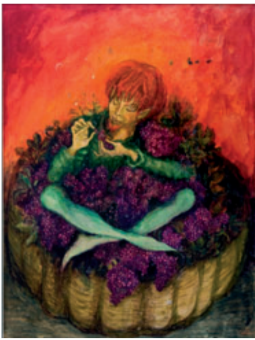
Dibujo de Ana María Matute

Ana María Matute. “En el bosque”. Discurso de ingreso en la Real Academia Española. 18 de enero de 1998.