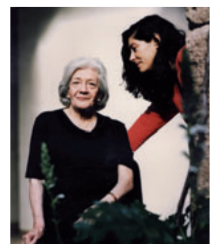
Con Almudena Grandes

Ana María Matute. El Mundo . 20 de abril de 2001.