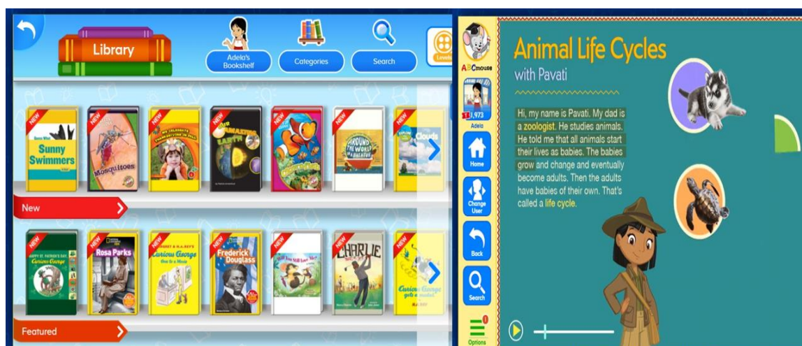
Figura 2. Biblioteca de e-books e interior de uno con detalles de lectura

Al abrir el entorno, nos encontramos con un aula que nos va a mostrar el aprendizaje por áreas y actividades curriculares. La secuencia “ My Learning Path ” nos lleva a una serie de entornos que reproducen tareas comunes de acuerdo a la edad de la estudiante. El entorno “ Classroom ” nos muestra una variedad de áreas de contenido curricular (Figura 3) donde destacan las matemáticas, las Ciencias Sociales, las Ciencias Naturales, la Escritura y Lectura de inglés como primera lengua, las Artes, la biblioteca y los juegos y puzzles. De manera singular quisiéramos destacar la biblioteca. La plataforma utiliza Jolly Phonics para el aprendizaje de la lectura en inglés (Figura 2). Aquí vemos el sobreado según lee, con aparición de imágenes de apoyo y dos velocidades de lectura.