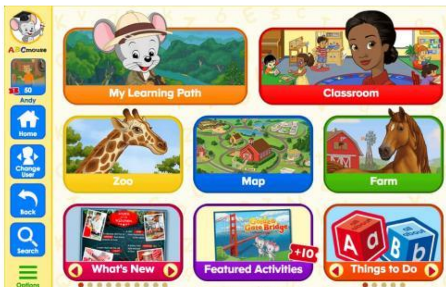
Figura 1. El entorno de aprendizaje

Al abrir el entorno, nos encontramos con un aula que nos va a mostrar el aprendizaje por áreas y actividades curriculares. La secuencia “ My Learning Path ” nos lleva a una serie de entornos que reproducen tareas comunes de acuerdo a la edad de la estudiante. El entorno “ Classroom ” nos muestra una variedad de áreas de contenido curricular (Figura 3) donde destacan las matemáticas, las Ciencias Sociales, las Ciencias Naturales, la Escritura y Lectura de inglés como primera lengua, las Artes, la biblioteca y los juegos y puzzles. De manera singular quisiéramos destacar la biblioteca. La plataforma utiliza Jolly Phonics para el aprendizaje de la lectura en inglés (Figura 2). Aquí vemos el sobreado según lee, con aparición de imágenes de apoyo y dos velocidades de lectura.