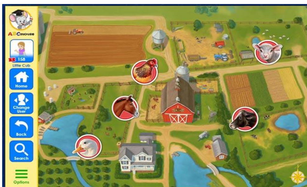
Figuras 4 y 5. Mapa conceptual de la plataforma