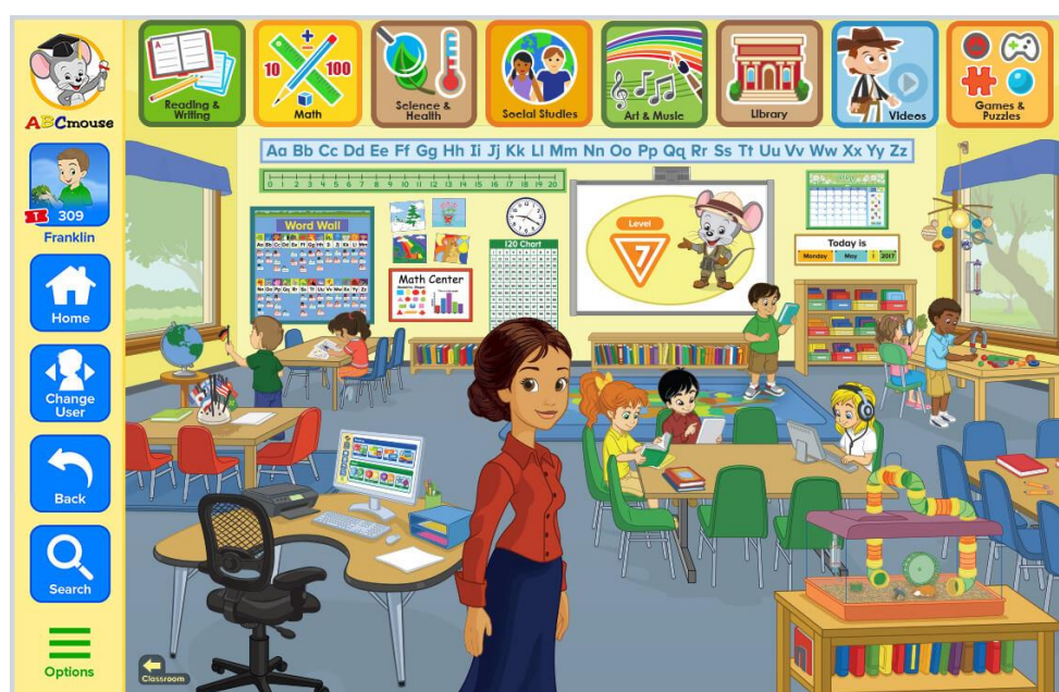
Figura 3. La clase

Asimismo, el 21 de enero de 2020 se lanzó Age of Learning Foundation cuyo objetivo es acompañar a gobiernos y ONG especialmente en países en vía de desarrollo los programa como ABC Mouse sin coste alguno para millones de niños de todo el mundo ( http://www.aofl.com/ ).