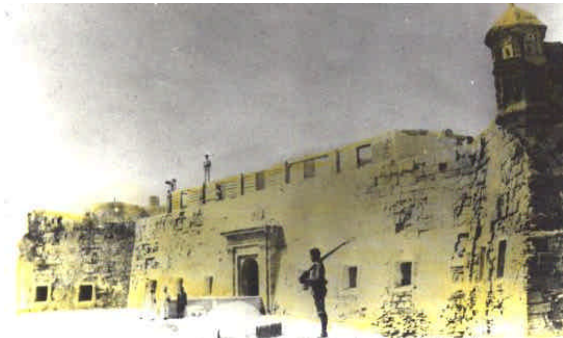
Fachada principal del Fuerte de Victoria Grande.-()

FOTO DE LA FACHADA PRINCIPAL DE "VICTORIA GRANDE"