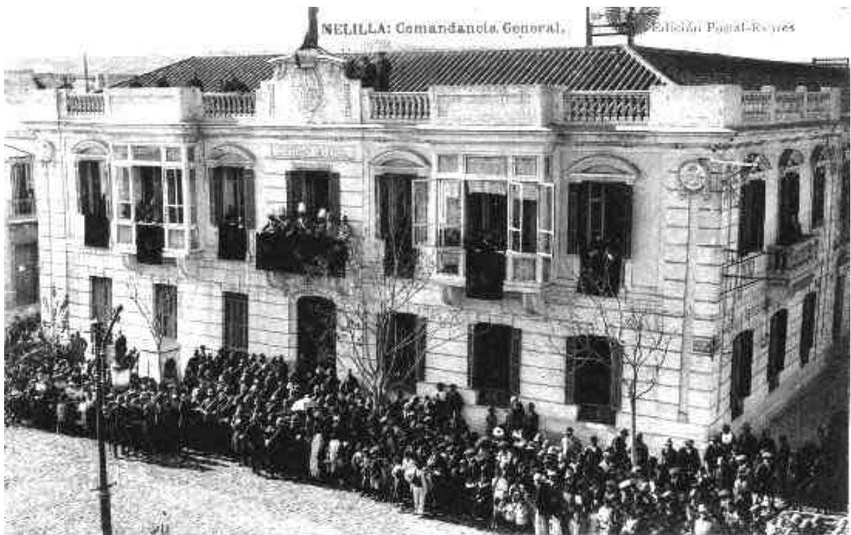
LA COMANDANCIA MILITAR EN DIA DE FIESTA

Detenidos en la Comandancia, esta pobre señora quedó tan harta de toda la familia Miaja y tuvo tan mala suerte, que cuando nos cambiaron por otros prisioneros no quiso estar en la lista; lo único que deseaba era regresar a su casa, cosa que nunca logró, ya que murió en casa de mi abuela en Melilla.