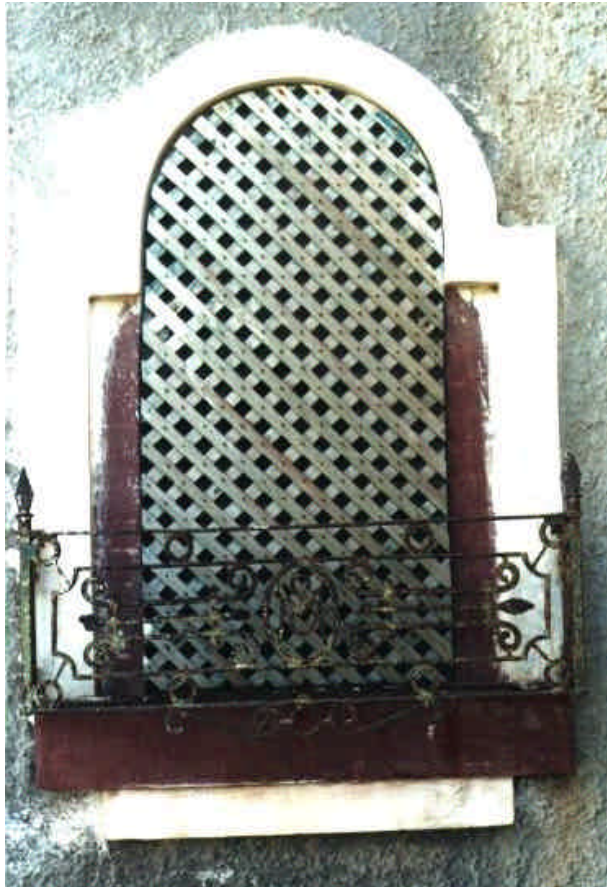
FOTO DE LAS VENTANAS QUE FUERON TAPIADAS CON CELOSIAS