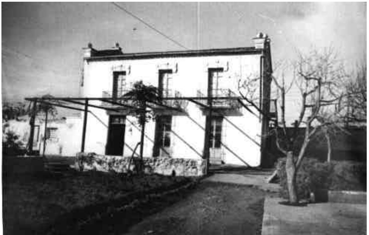
FOTO DE LA HUERTA

esta casa que nosotros adorábamos: era nuestro máximo gozo estar allí. Pues bien, para hacer mi relato más verídico, en los primeros meses de 1998, en México, me puse en contacto con varios historiadores Melillenses, quienes me enviaron varias fotografías actuales de la casa y...qué gran decepción.