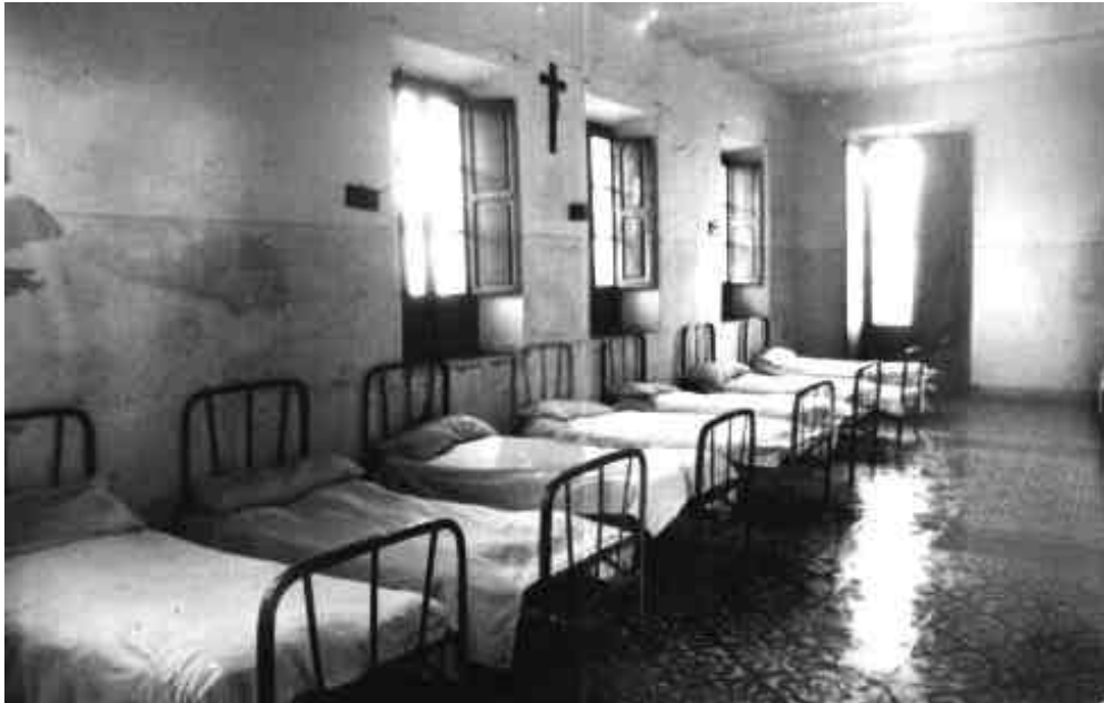
FOTO DEL PISO DE LA PARTE ALTA CONVERTIDO EN DORMITORIO