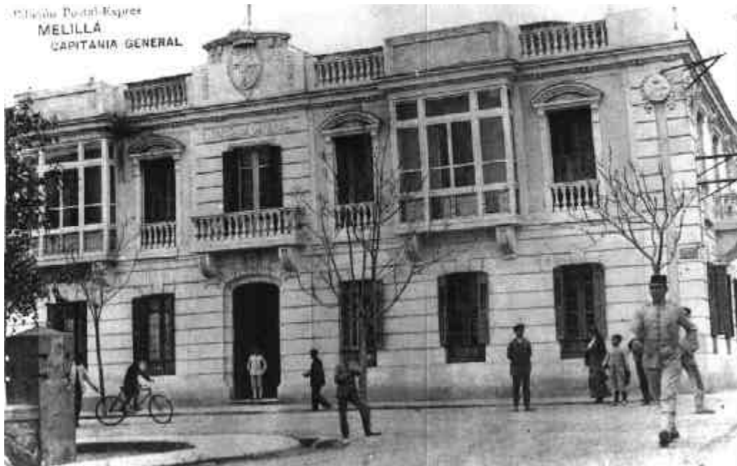
LA COMANDANCIA MILITAR