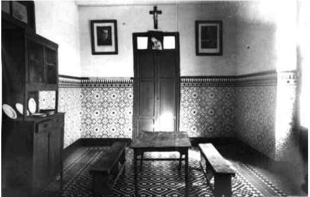
FOTO DEL PISO DE ABAJO CONVERTIDO EN COMEDOR Y OFICINAS

El 4 de Julio de 1932, en Melilla, mi padre fue ascendido a General de Brigada; los destinaron a Badajoz, provincia de Extremadura; después lo mandaron a Madrid, pero siempre los veranos los pasábamos en Melilla. Así que en junio de 1936, cuando nos dijo que iríamos como siempre a pasarla allí, se nos hizo de lo más agradable y normal.