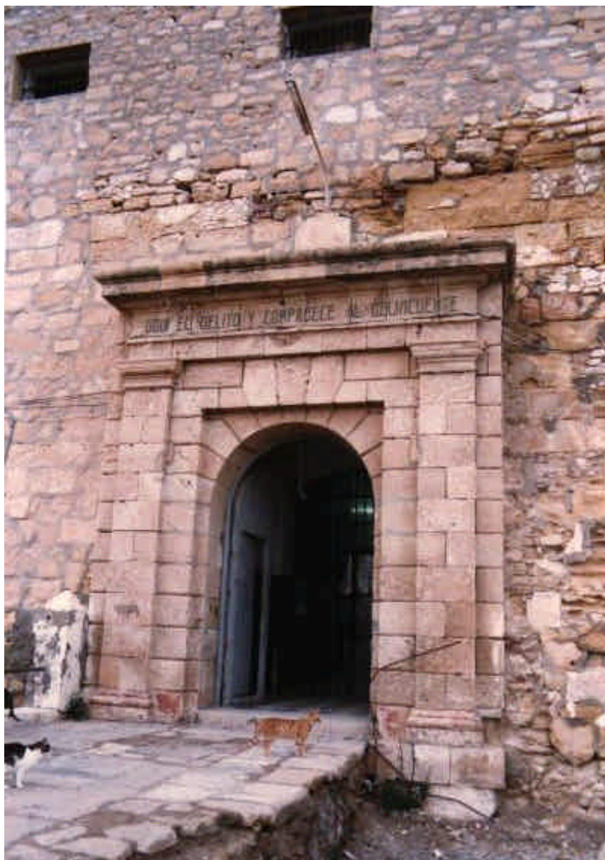
ENTRADA AL TENEBROSO MUNDO DE LA CÁRCEL <VICTORIA GRANDE>

A los pocos días del fusilamiento del General Romerales, su familia regresó a España y a nosotros nos trasladaron a una cárcel que se llamaba <Victoria Grande>, a la que llegamos ya anocheciendo. Parecía una fortaleza enorme (o por lo menos así la veía yo) de piedra, llena de rejas en las ventanas y rodeada por el mar. En ese momento era una cárcel para mujeres, en la que estaban mezcladas presas políticas y presas comunes y como era territorio marroquí, las había moras, vestidas a la usanza de ellas; la limpieza dejaba mucho que desear. A mi hermano y a mi cuñado se los llevaron a un campo de concentración llamado <Zeluan>.