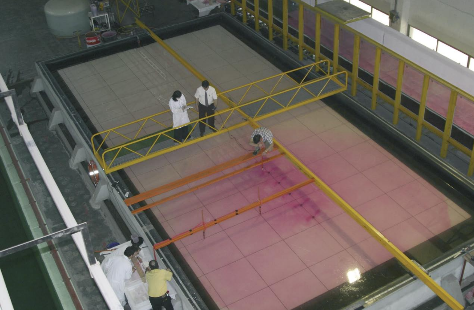
Tanque de ensayos

Naturalmente, este mismo cálculo puede hacerse para las diferentes cuencas y subcuencas hidrográficas de un mismo país.