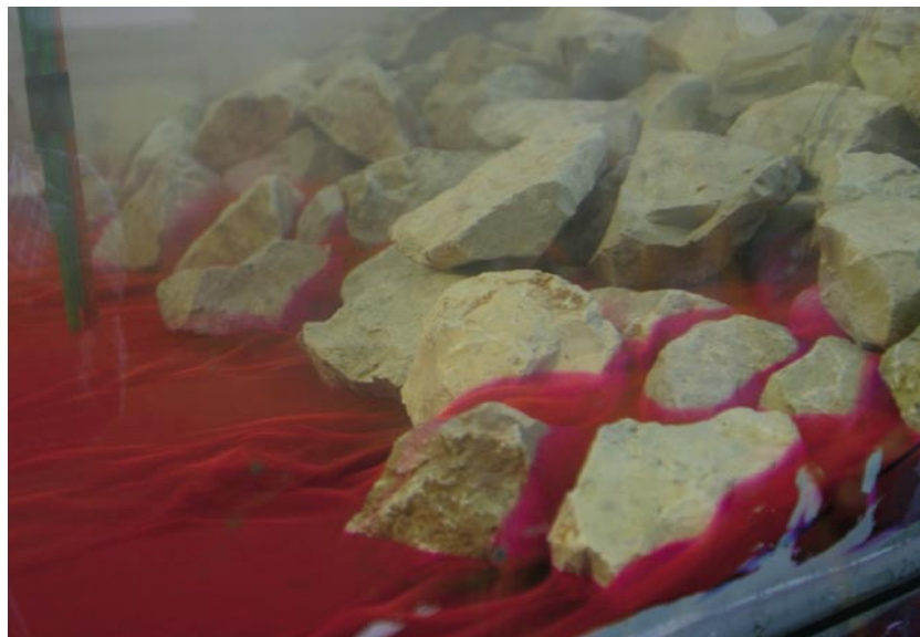
Ensayos canal de escollera

parte, la Dirección General de Costas y los Servicios Cartográficos de las Comunidades Autónomas disponen de fotografías aéreas que también pueden ser de utilidad.