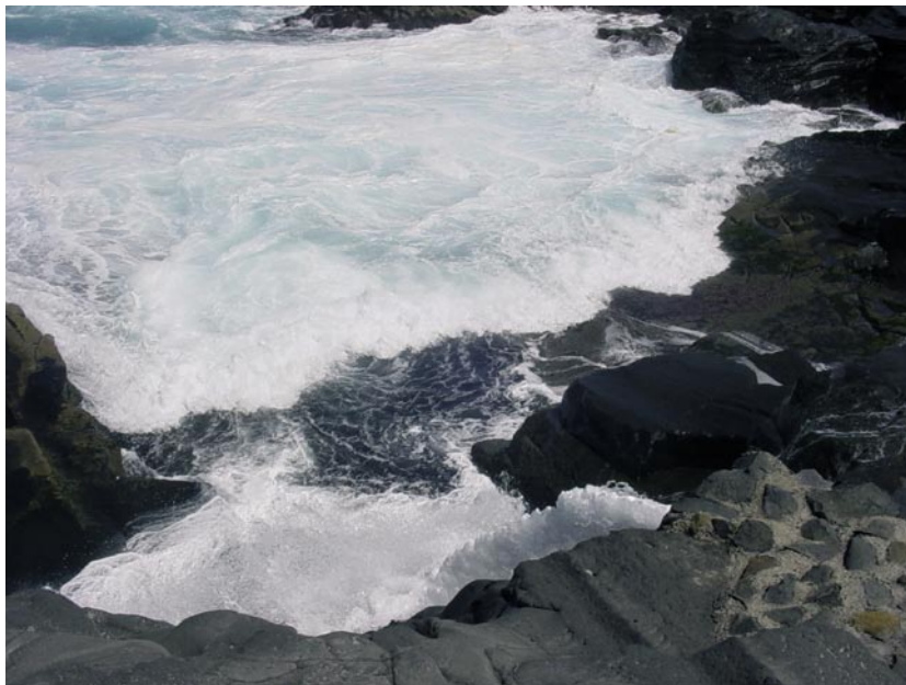
El residuo más importante de una planta desaladora por su magnitud está constituido por las aguas de rechazo. Tanque de ensayos