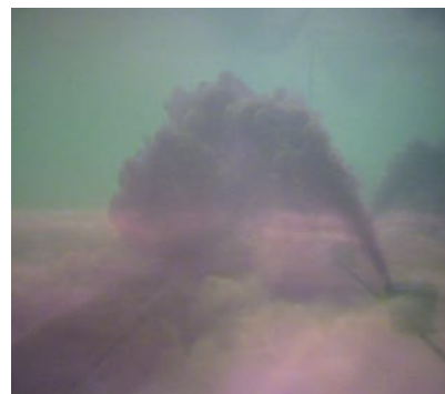
Ensayos de difusor tomados con cámara submarina