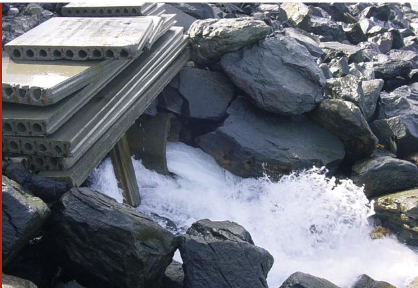
Cuando el efluente llega al mar, su energía cinética provoca turbulencias que producen un rápido mezclado parcial con agua del medio receptor incluso si éste está en calma

de cálculo que permitan conocer el comportamiento del vertido en el campo cercano (al menos geometría y dilución obtenida) para los múltiples dispositivos de vertido que se están utilizando y el del campo lejano para flujo no encauzado (análisis tridimensional). Precisamente estos son los objetivos de un trabajo de investigación encargado al CEDEX por la Dirección General del Agua y que está en marcha desde finales de 2004.